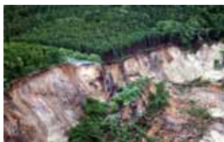
岩手・宮城内陸地震